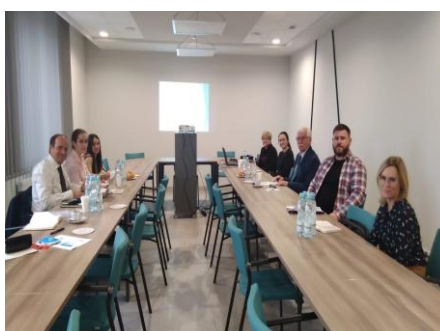
Polónia - Reunião na Wschodni Klaster Obróbki Metali – Cluster de Metalomecânica – 09.11.2021