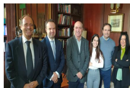
Polónia - Reunião com Związek Pracodawców Producentów Materiałów dla Budownictwa - 10.11.2021