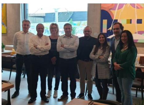
Luxemburgo - Reunião com responsável pelo Jornal “BOM DIA” – 27.09.2021

As duas Associações Empresariais Regionais (AEA e AECA) atuam numa região alargada onde se localiza a maior parte das empresas industriais das fileiras da Metalomecânica e da fileira do Habitat (mobiliário, decoração, têxtil lar, cutelaria, utensílios da fileira casa, etc.) detentoras de capacidades provadas ao nível da inovação e do desenvolvimento de produtos que respondam com valor acrescentado às necessidades do mercado global.